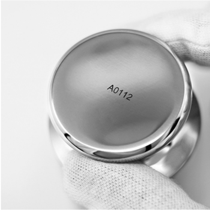
Esempio di marcatura laser opzionale